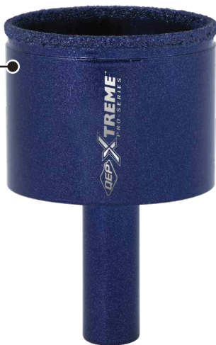
35 mm À eau/À SEC Scie-cloche diamant