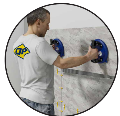
HACE FÁCIL LEVANTAR CARGAS PESADAS