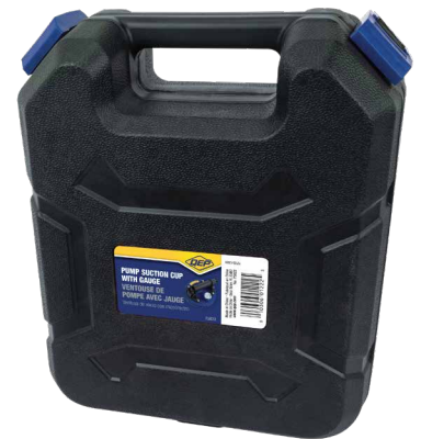
CONVENIENTE Estuche de protección para cargarla