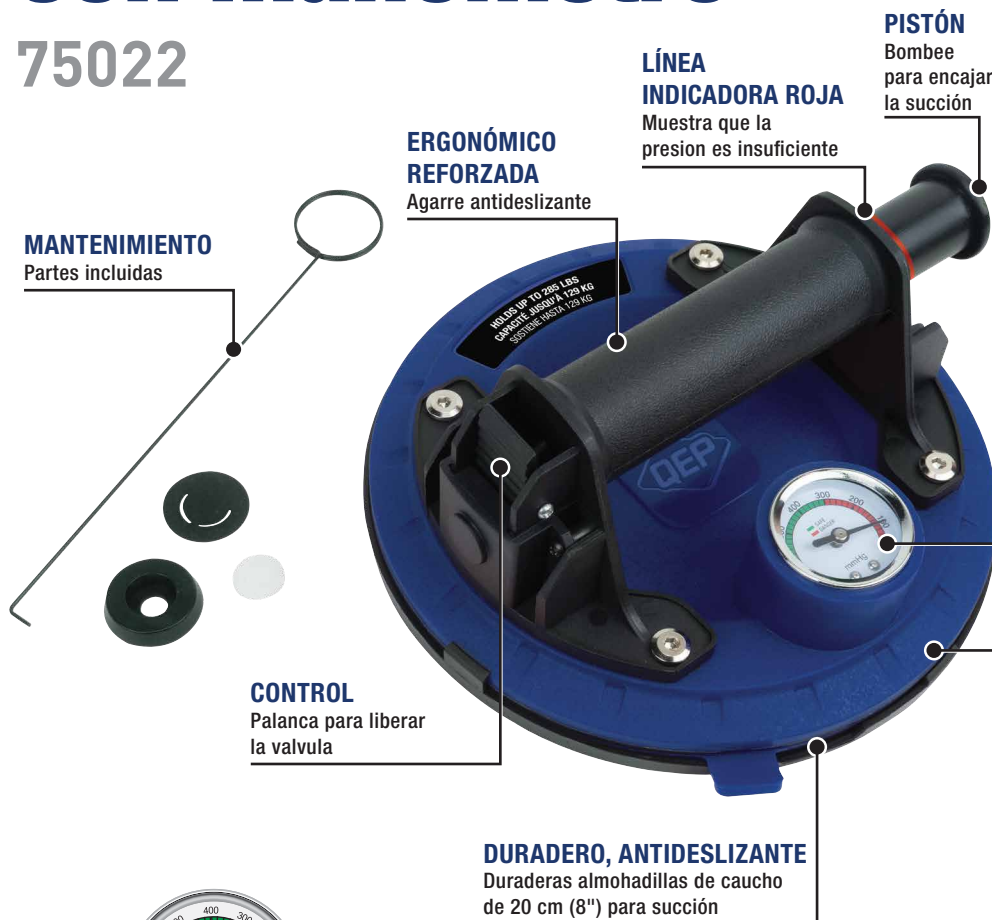
MANÓMETRO DE SUCCIÓN DE SEGURIDAD El color rojo indica que no hay suficiente presión